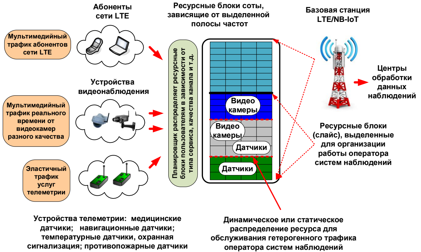
Рисунок 1 — Функциональная модель узла доступа

Пусть в момент поступления запроса i_r — число единиц ресурса, занятых на обслуживание трафика реального времени, а d — число обслуживаемых сессий на передачу эластичных данных. Запрос k -го потока принимается к обслуживанию, если выполняется условие i_r + d + b_k \leq v . Выполнение данного условия означает, что все заявки на пересылку файлов уже получают для своего обслуживания один канал и дальнейшее уменьшение скорости передачи эластичных данных невозможно. Таким образом, в ситуации i_r + d + b_k > v поступивший запрос получает отказ и не возобновляется. Аналогично, поступление запросов на передачу эластичных данных подчиняется пуассоновскому закону с интенсивностью \lambda_d . Поступивший запрос принимается к обслуживанию, если выполняется условие i_r + d + 1 \leq v . Объём пересылаемого файла, выраженный в битах, имеет экспоненциальное распределение со средним значением F . Обозначим через \mu_d = r/F параметр экспоненциального распределения времени передачи файла с использованием передаточных возможностей одной канальной единицы.